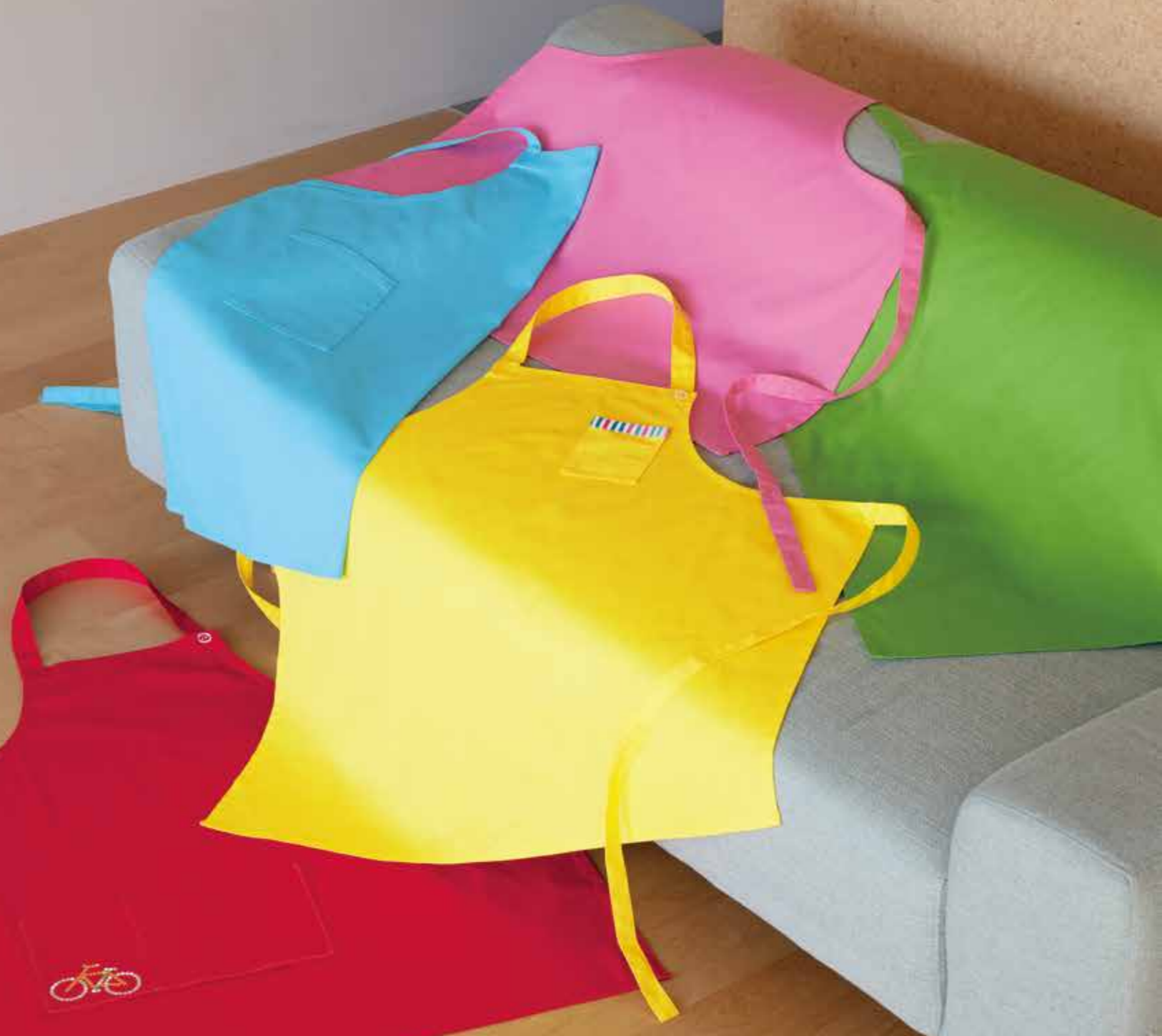
*作品は、飾り付けキット等で飾り付けをしています。