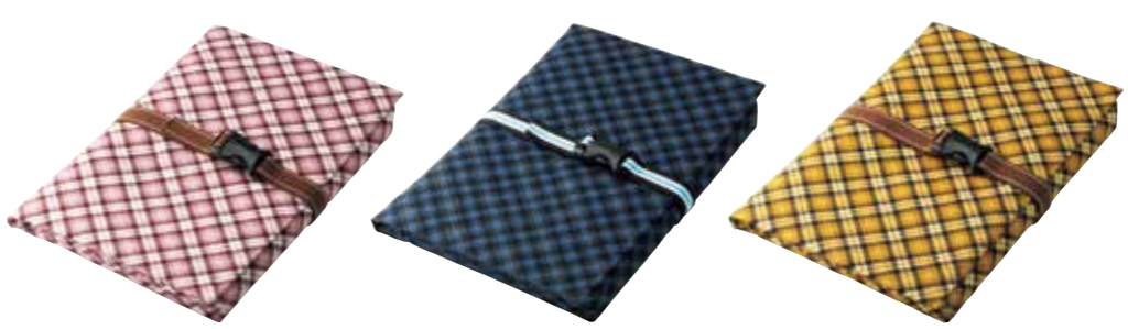
10 ハイアスチェック 桃 374 11 ハイアスチェック 紺 372 12 ハイアスチェック 黄 375