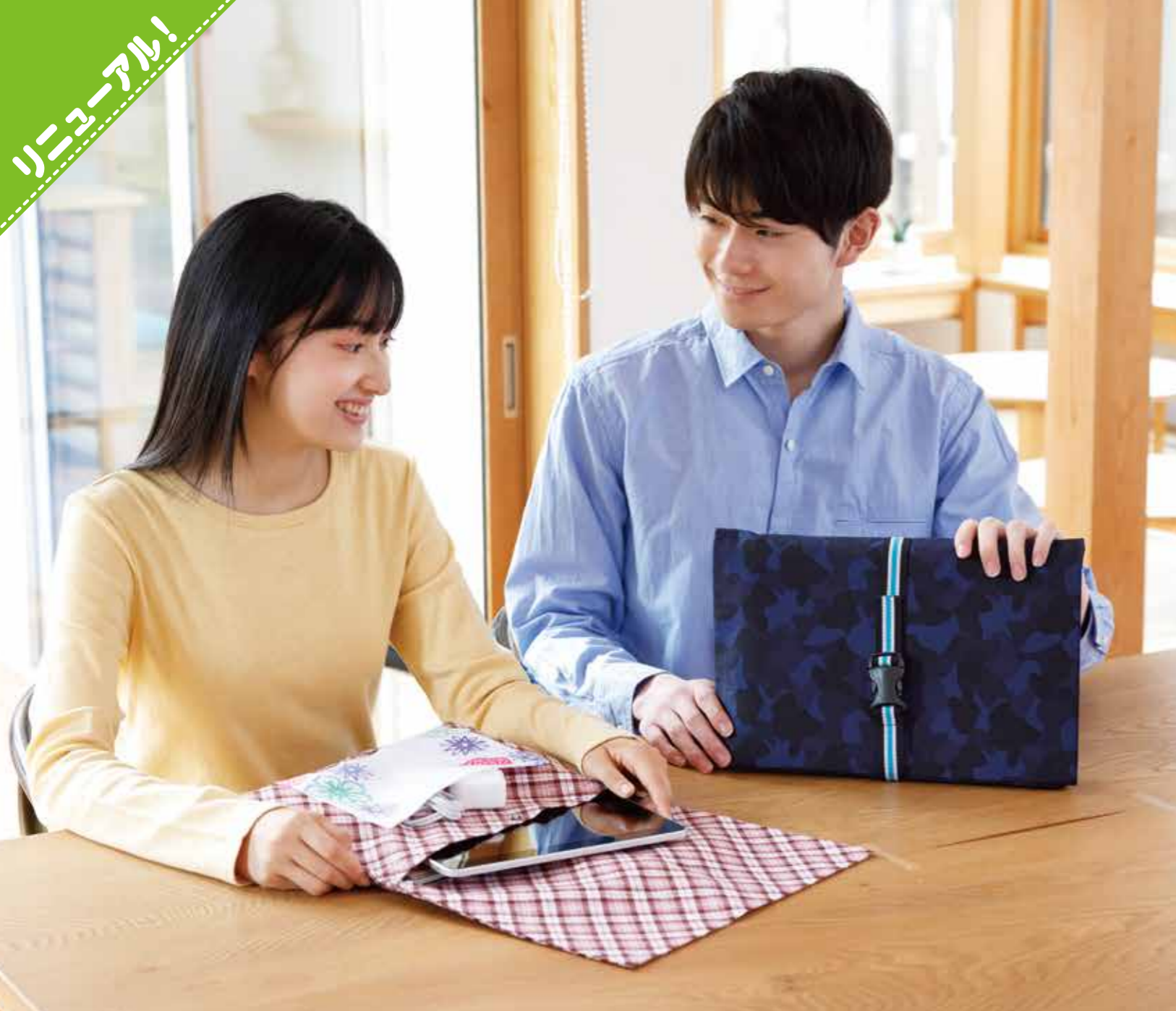
*ポケット用の布は、セットに含まれておりません。作品は、山の幸染めた布をポケットにしています。