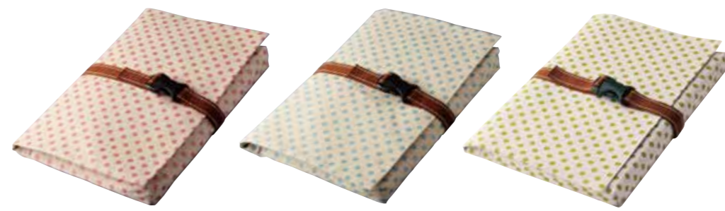
04 水玉ラメ 桃 504 05 水玉ラメ 水 505 06 水玉ラメ 黄緑 506