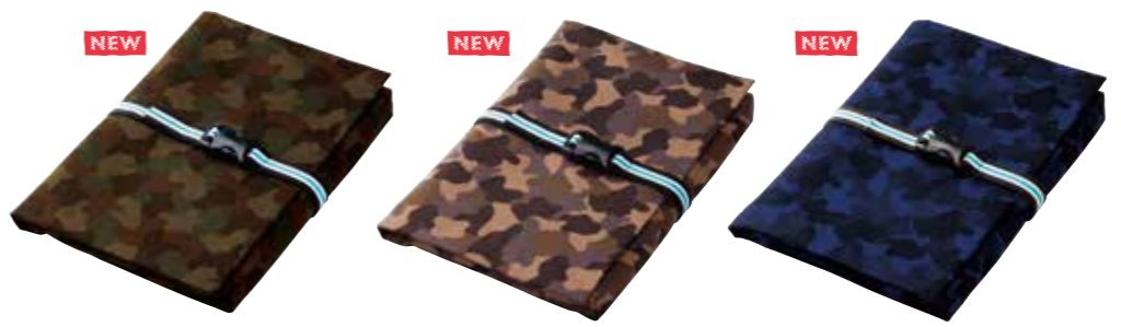
07 ツイル迷彩 カーキ 432 08 ツイル迷彩 グレー 437 09 ツイル迷彩 ネイビー 438