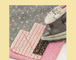
アイロン定規 5-4268 1,070円