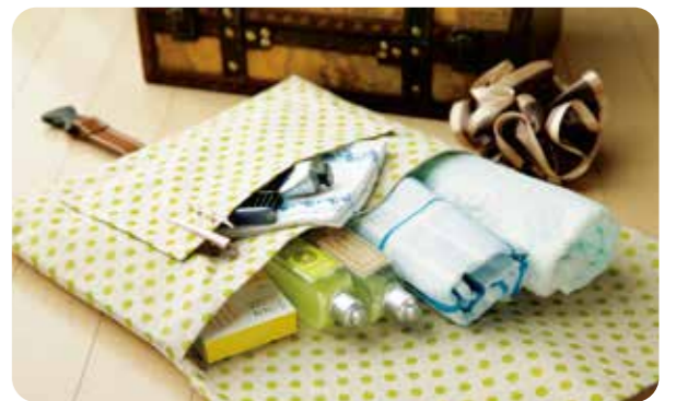
*ポケット用の布はセットに含まれておりません。

先生の声から生まれました! プリントファイル以外の勉強道具も一緒に入るバッグがあったら、移動教室の時に使えて便利。