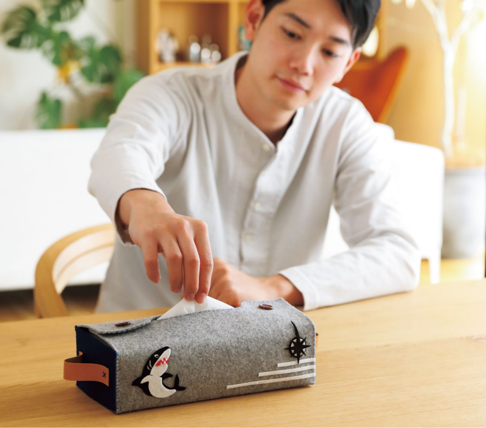
*作品は、別売品等を使って飾り付けをしています。ティッシュはセットに含まれておりません。