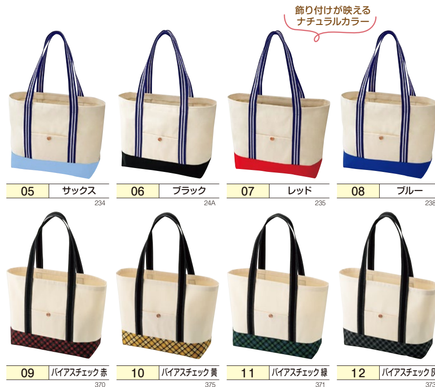
05 サックス 234 06 ブラック 24A 07 レッド 235 08 ブルー 238 09 ハイアスチェック赤 370 10 ハイアスチェック黄 375 11 ハイアスチェック緑 371 12 ハイアスチェック灰 373