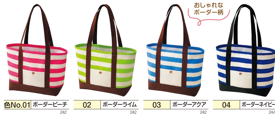
色No.01 ボーダーピーチ 242 02 ボーダーライム 242 03 ボーダーアクア 242 04 ボーダーネイビー 24A